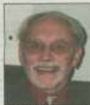
ACHICOURT - MANINGHAM

Pompes Funèbres BOULANGER 4310 WIMALDE ☎ 03.21.83.45.12